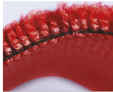
100% PET Teppich